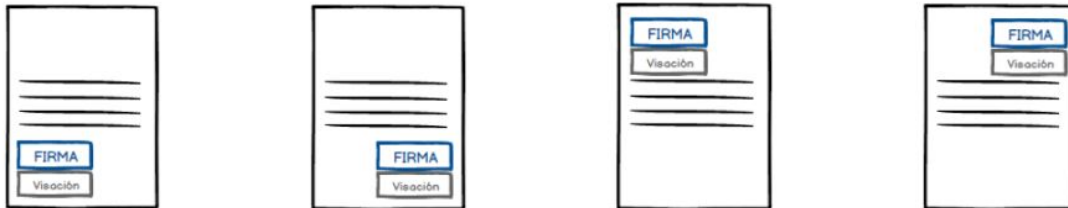
"Ejemplos de plantillas de documentos"